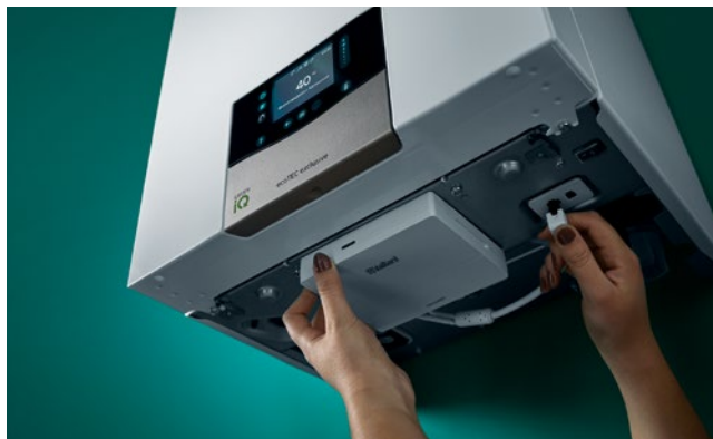
Instalirajte sustav sensoNET u tren oka