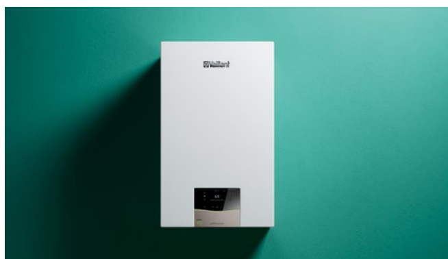
ecoTEC plus VUW

Zahvaljujući njegovoj novoj inteligentnoj značajki „IoniDetect“, uređaj potpuno samostalno upravlja promjenama u vrsti i kvaliteti plina. Svojim kupcima uvijek možete jamčiti optimalno izgaranje, a da sami niste morali ništa učiniti.