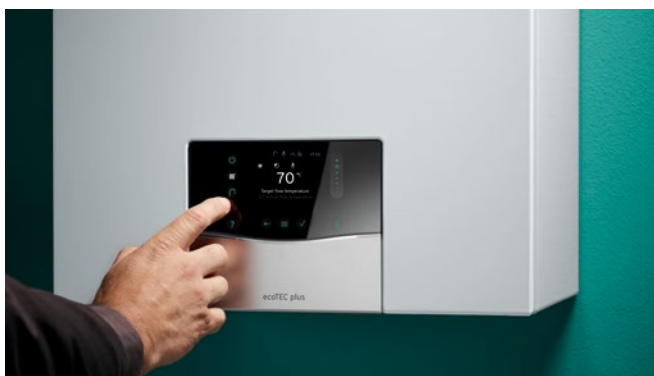
Udobnost upravljanja putem integriranog rada na dodir

Novi usklađen dizajn i koncept rada sučelja naših plinskih kondenzacijskih uređaja za grijanje zajedno s našim regulatorima, ugradnju i korištenje čini bržim no ikada. Brza daljinska provjera i prilagodba uređaja za grijanje putem našega novog sensoCOMFORT regulatora i aplikacije sensoAPP.