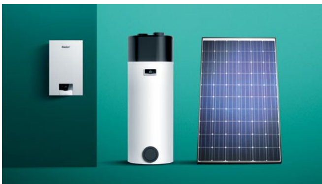
Fleksibilna integracija u sustav.

Novi usklađen dizajn i koncept rada sučelja naših plinskih kondenzacijskih uređaja za grijanje zajedno s našim regulatorima, ugradnju i korištenje čini bržim no ikada. Brza daljinska provjera i prilagodba uređaja za grijanje putem našega novog sensoCOMFORT regulatora i aplikacije sensoAPP.