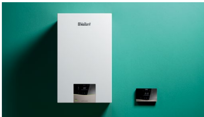
ecoTEC exclusive uređaj sa sensoCOMFORT regulatorom

uređaji opremljeni izmjenjivačem topline od nehrđajućeg čelika za najbolji mogući rad. Uz dokazane i pouzdane komplecte za ugradnju, uvelike vam olakšavaju montažu. Zahvaljujući uklonjivim dijelovima kućišta, sve su glavne komponente savršeno dostupne za lako održavanje.